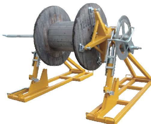
CVI810 s CDR057 a DF059